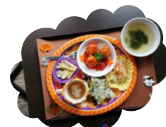
10月のハロウィンメニュー